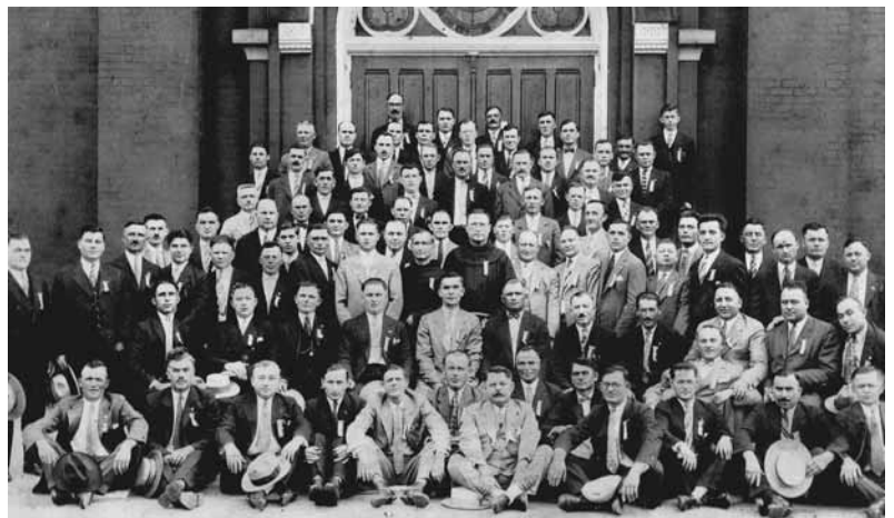
HRVATSKI RADIŠA, 1928.

Na Badnjak jedne godine, bilo je to nakon večernje mise ili mise polnoćke, nestao je, nismo značili gdje je. Nakon dugoga traženja našli su ga u našoj crkvi Sv. Jeronima, u mraku gdje sjedi (crkve su tada bile otvorene cijelu noć). Vani je bilo nevrijeme, led i snijeg još u vrijeme mise. On je ostao u crkvi dok drugi nisu ni primjetili. "Tata, mi nismo znali gdje si bio", rekla je moja majka. "Zašto si još uvijek ovdje?" On nije bio senilan i iako je bilo neobično za njega hoditi negdje sam. Majka je rekla da je on podigao pogled i tužnim riječima rekao joj: "Ali nisam mogao hodati vani sam." Oni su ga uzeli i povelu doma. Takvi su bili