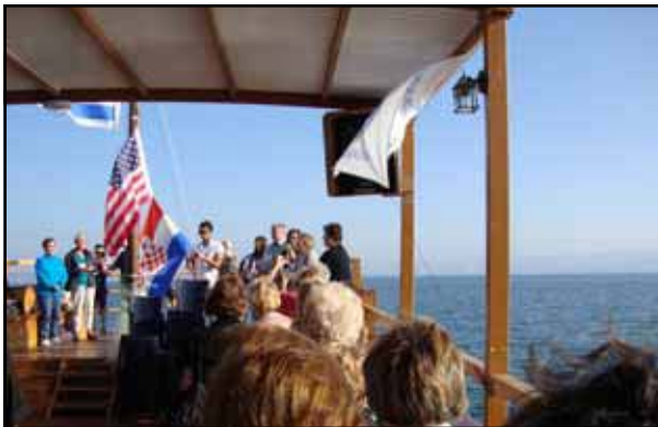
Na našem brodu na Galilejskom moru.

Napustili smo Jerihon kako bismo posjetili još i Rijeku Jordan , mjesto Isusova krštenja. Takodjer ovdje se nalazi i državna granica između Jordana i Izraela. Ovdje sam obnovio krsne zavjete za svakoga od nas pojedinačno. Svatko pojedinačno je ušao u rijeku Jordan, a ja sam svakome ponaosob izlio vodu po glavi, kao spomen na njihova osobna krštenja. Moćan trenutak. Odvezli smo se prema sjeveru, zapadnim bedemom ka Galileji, i to vozeći se istom cestom kojom se hodilo i u vrijeme Isusovo. Jedina je razlika, reklo bi se, asfalt ispod nas i vozila na asfaltu. Sve ostalo, isto je.