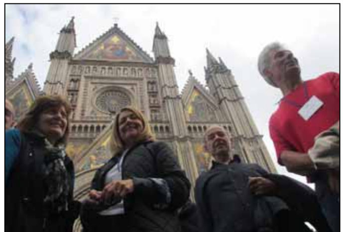
Katedrala u Orvietu