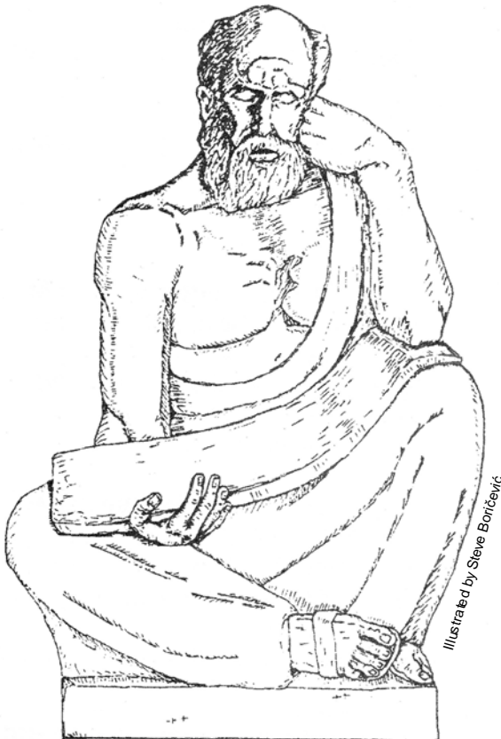
St. Jerome by Ivan Meštrović

St. Jerome Croatian Catholic Parish Hrvatska katolička župa sv. Jeronima